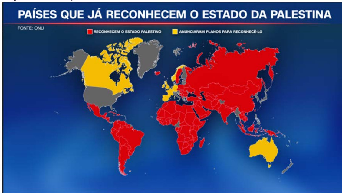
Imagem 1 – Atual situação do reconhecimento do Estado da Palestina

Como demonstrado nas seções 1 e 2 deste artigo, o controle israelense no que tange à alimentação da população palestina – em especial na Faixa de Gaza – não é algo recente. O estabe-