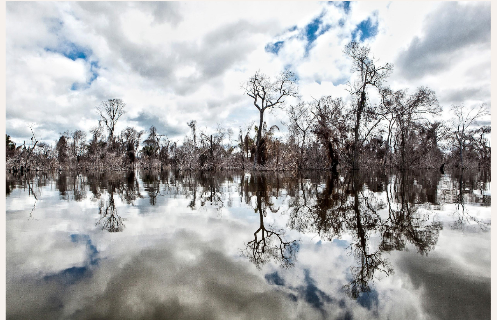
Paliteiros (rio e floresta morta)