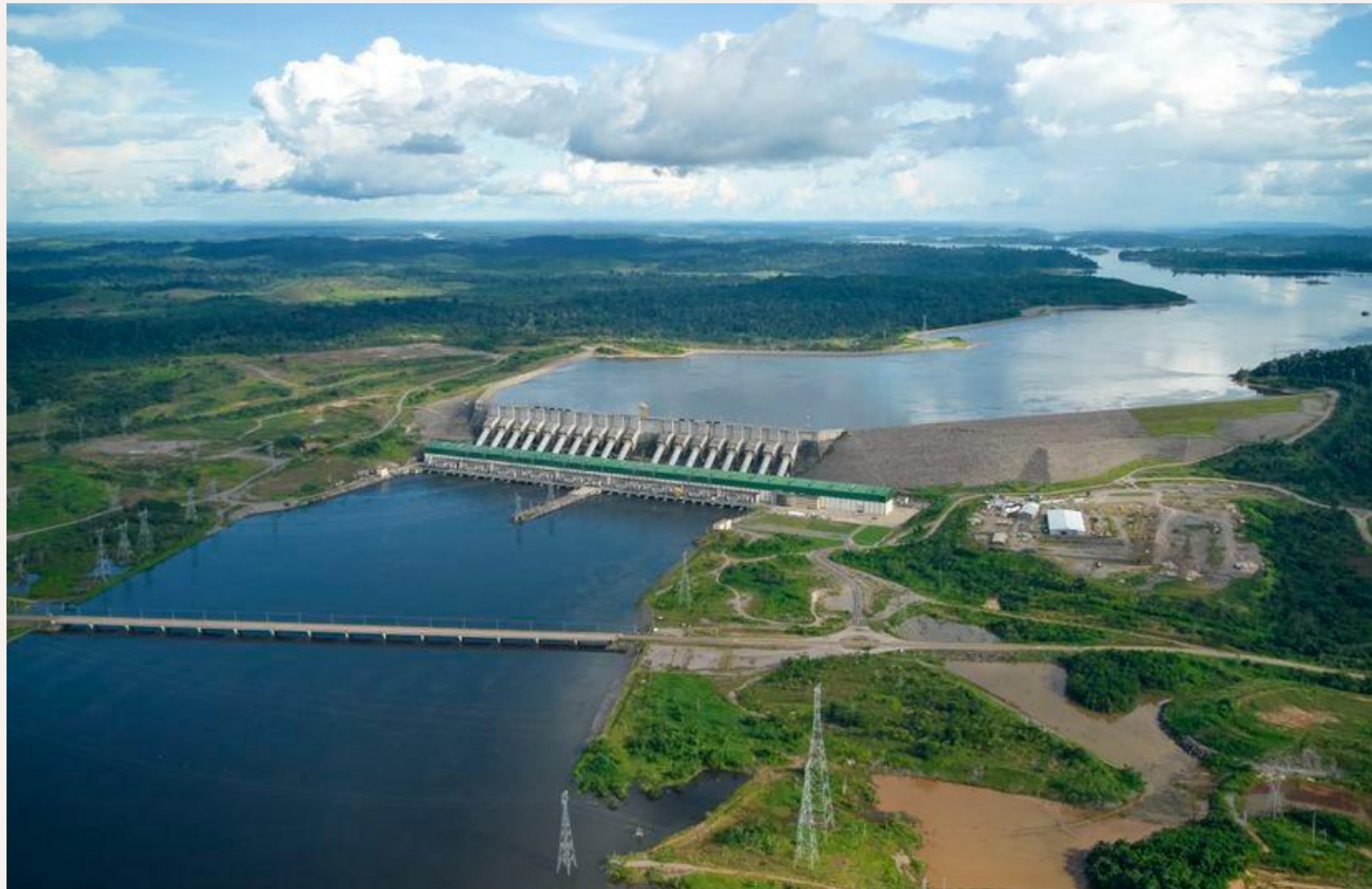
UHE Belo Monte