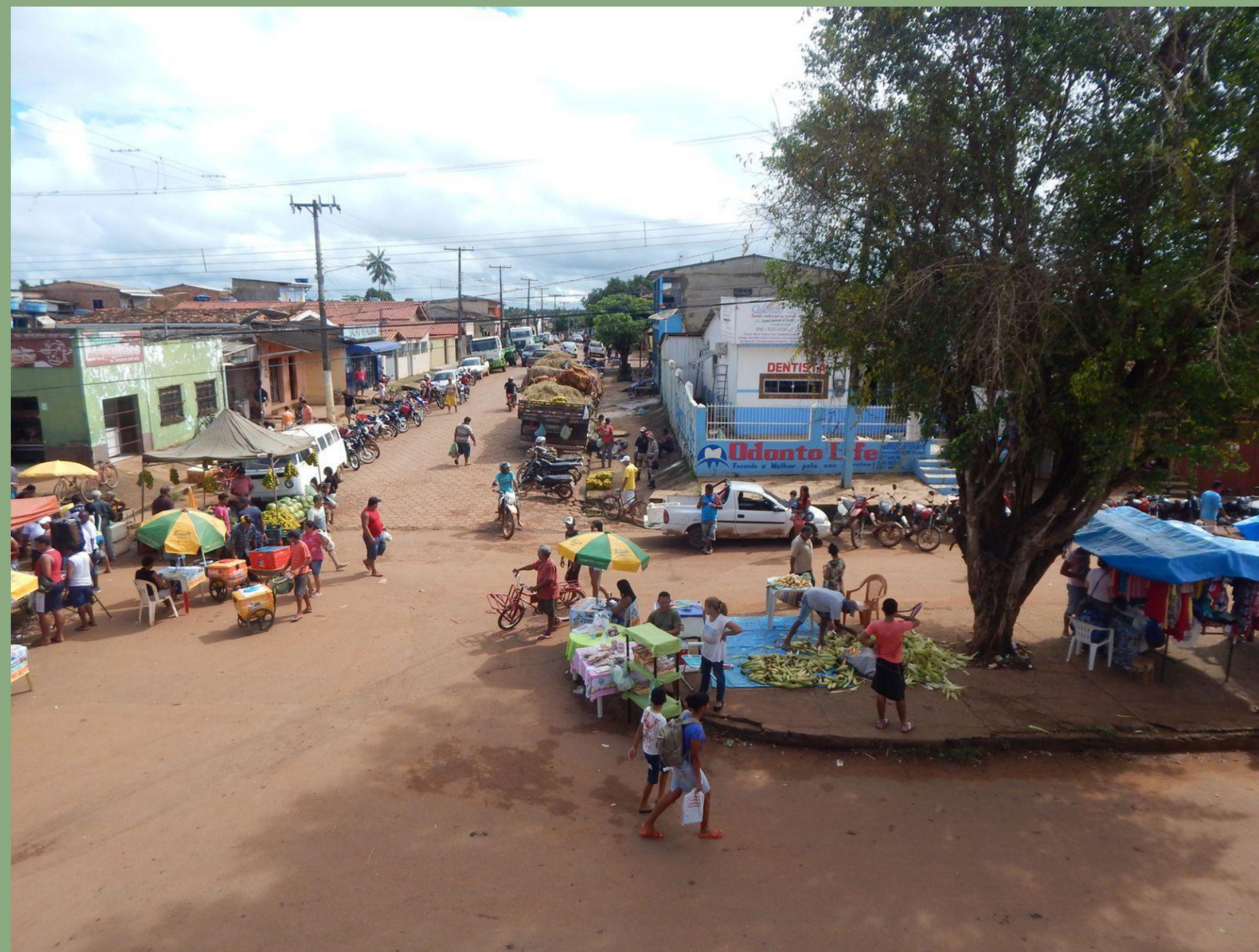
Antiga feira de rua na região do Baixão antes da instalação da UHE Belo Monte

Áreas arborizadas com frutíferas e hortas comunitárias nas áreas urbanas da Amazônia